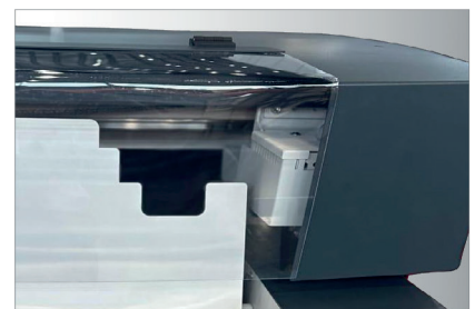
Veilige constructie, geen risico op vingers tussen de rollen.