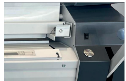
Constance kwaliteit, met één druk op de knop.