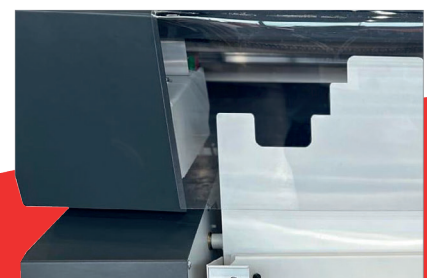
Optioneel PGO Gen 5 opruwsysteem: Rugpreparatie voor moeilijke papersoorten.

Albyco Nederland B.V. Elschot 2 NL-4905 AZ Oosterhout Tel.: +31 162 486286 sales@albyco.com www.albyco.com